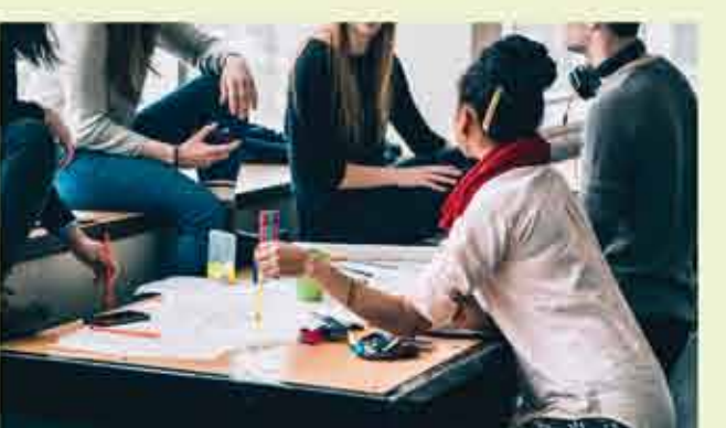
* ملاحظة: استعمل صيغة المتكلم هي لفظ للاختصار، المقصود بها كلا الجنسين، نرجو المعذرة.

لا تنسى بإمكانك طلب مترجم إذا كنت لم تتكلم بعد من اللغة الألمانية، أو احضر معك شخصا يستطيع الترجمة.